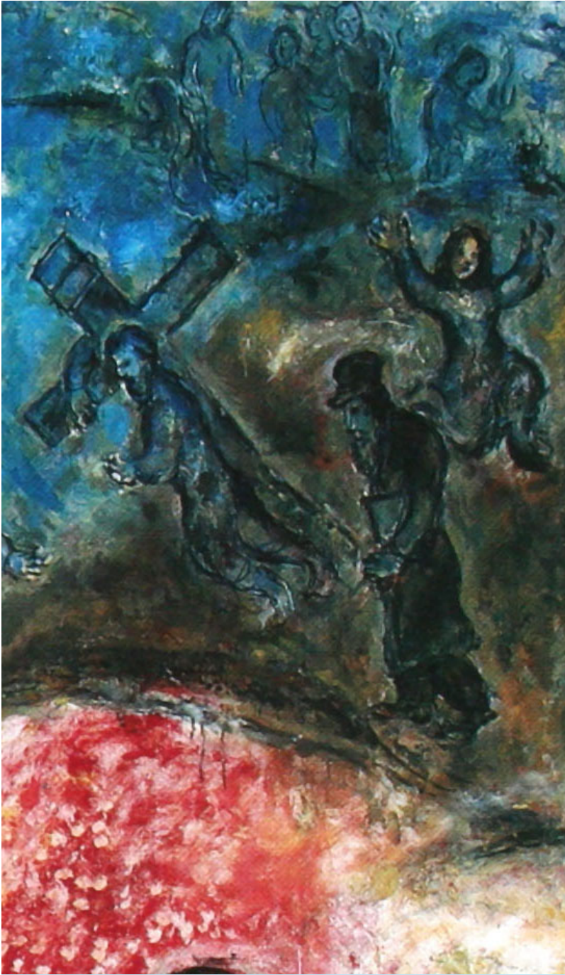
Marc Chagall, Le sacrifice d'Isaac (détail) , Musée du Message biblique Nice