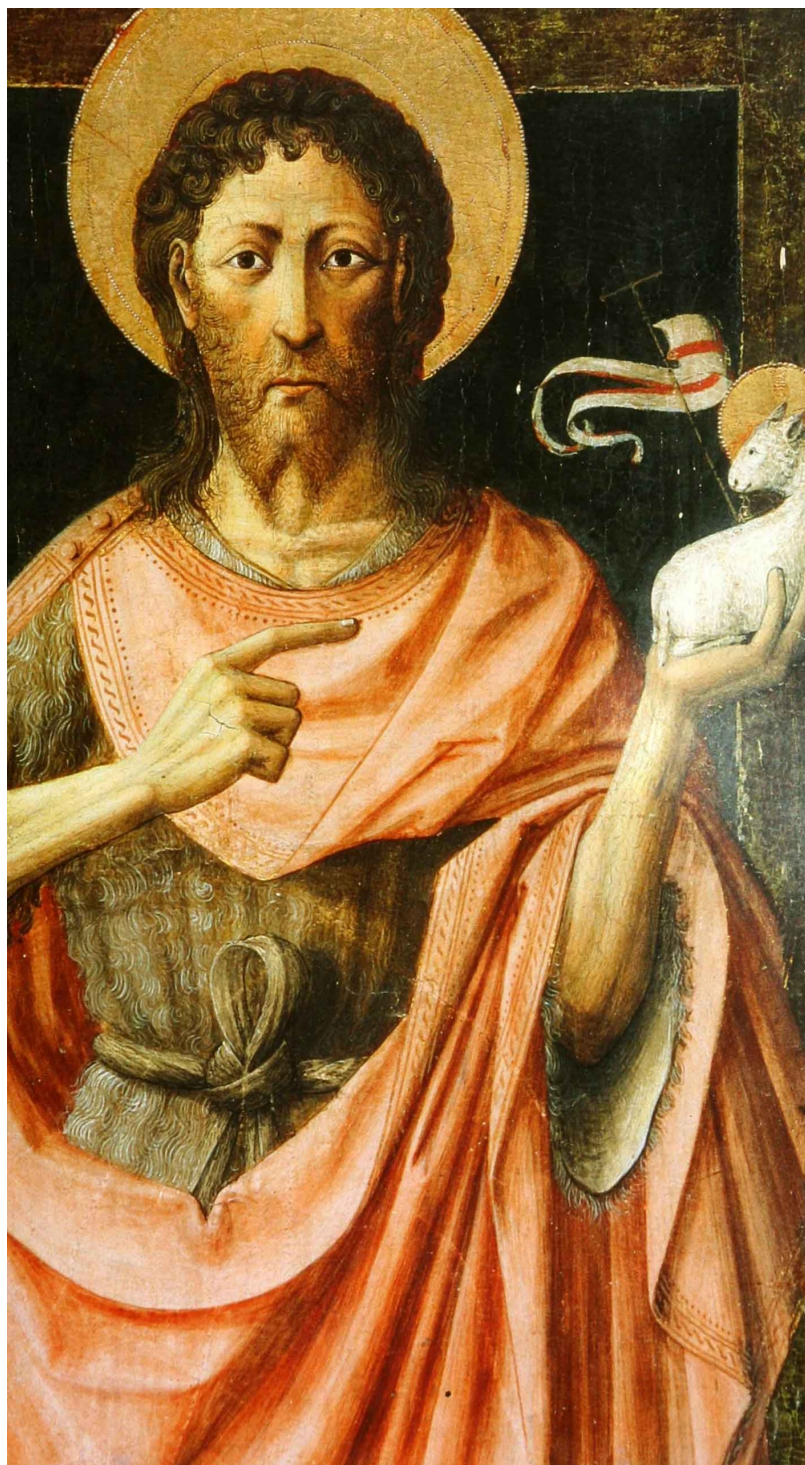
Saint Jean le Baptiste