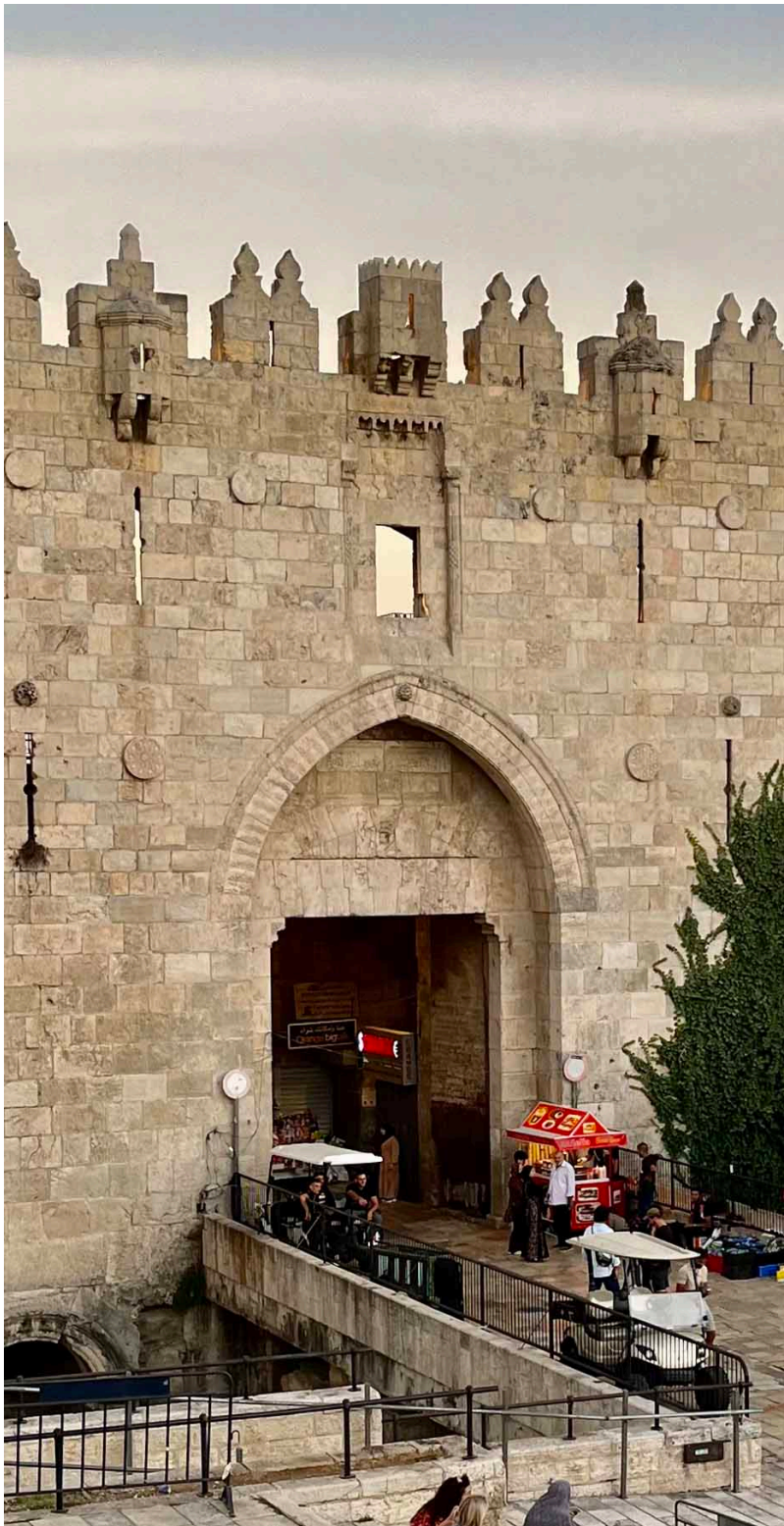
Porte de Damas