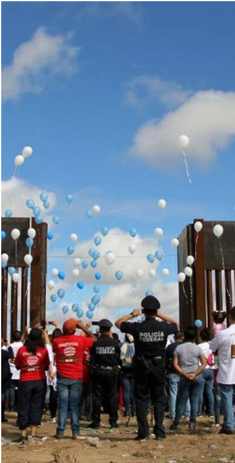
Frontière Mexique / USA