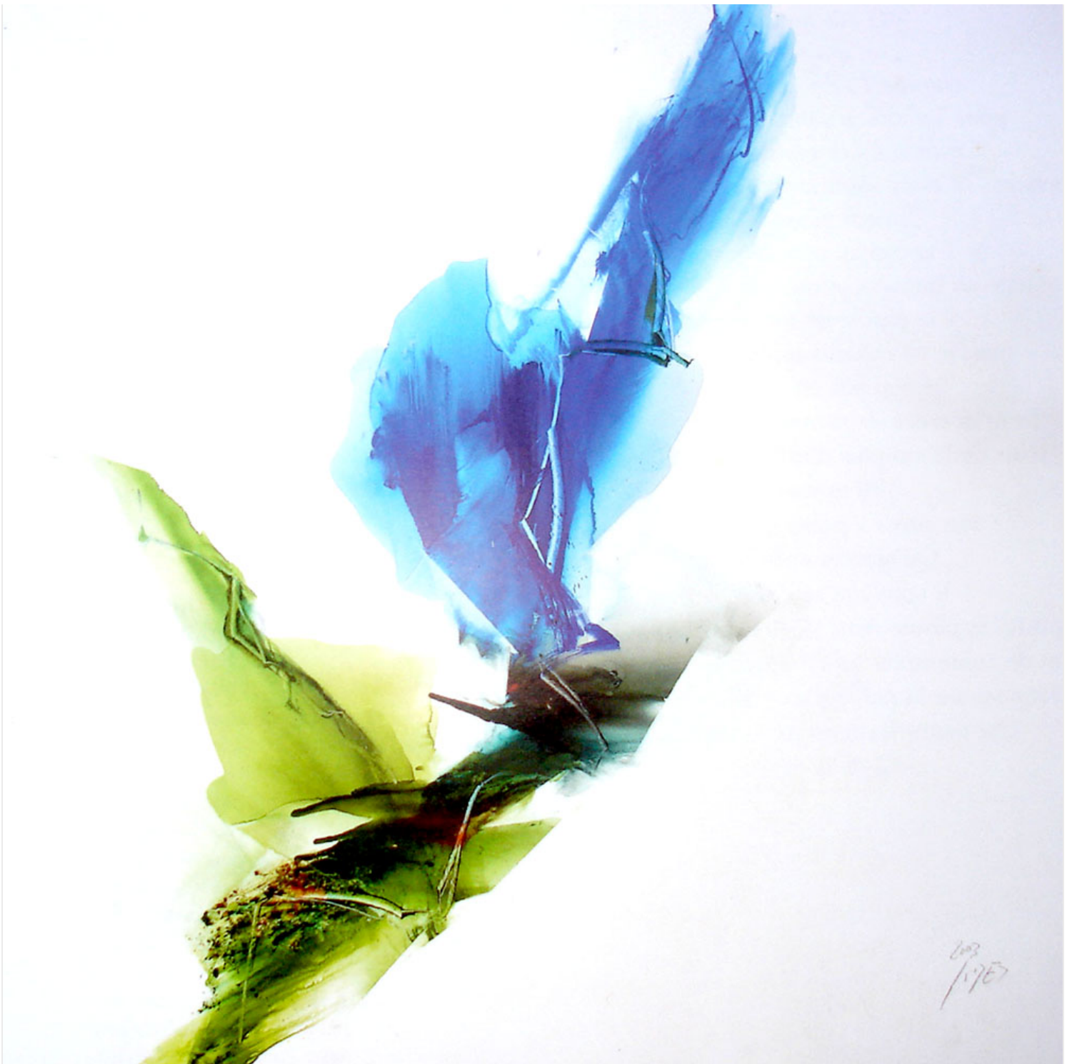
Les trois venues du Christ