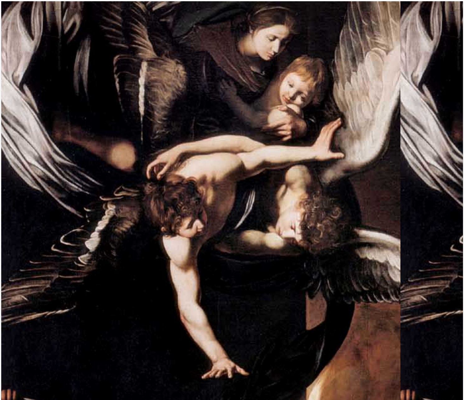
L'effusion de la Miséricorde