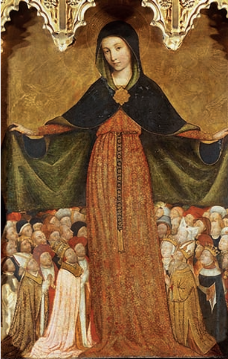
La Vierge de Miséricorde